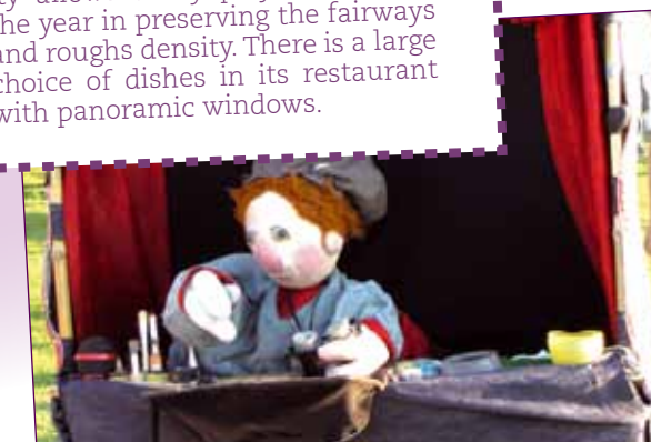
La Fête dans la rue à Corbie.

Such as our traditional Picard Games. It is often possible to discover around a small village main square, in the shade of lime trees a team of players of one or the other of them.