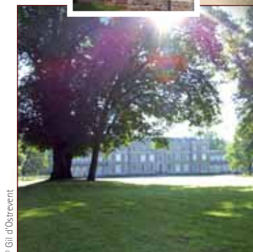
Château de Querrieu.

Find back the tracks of our old ancestors from the Neolithic period up to the Gallo-Roman one. The Bavelincourt menhir – said "Oblicamps stone" – is one of the rare megalithic one in the department. Ribemont-sur-Ancre archaeological site is one of the richest and widest of the North of France. Little by little it reveals the mysteries of vestiges dating back from the Gallo-Roman period.