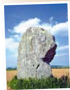
Menhir de Bavelincourt.