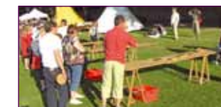
La Fête dans la rue à Corbie.

Give the brand new play equipments a try and share good times in the swimming pool against the current. Go down the 25 metres "Pentagliss" slide, fitted with 4 lanes, try on the sauna, solarium, and all the many other marvellous equipments of the swimming pool. Besides, evening parties on different topics are regularly organised in original surroundings.