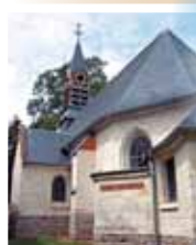
Eglise de Montonvillers

Centre archéologique de Ribemont-sur-Ancre.