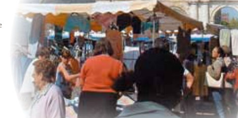
Marché à Corbie