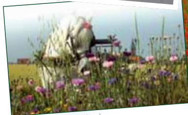
© Association Pensée de Le Hamel