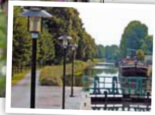
Halte fluviale à Corbie.

Come and enjoy a relaxing stay in our region, ideally situated near our regional capital. Going upstream east of Amiens, you will be charmed by this land nestling in the heart of three valleys right out in the countryside.