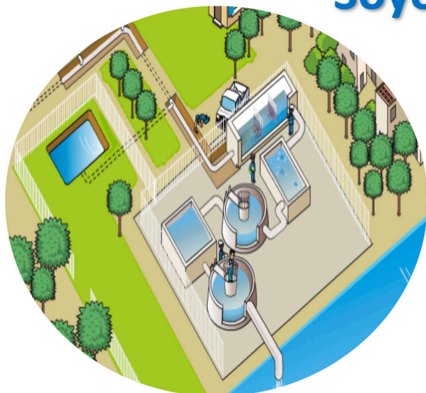
Illustration : Cleau www.cieau.com

La Station d'Épuration (ou Usine de Dépollution) : Nos eaux usées , c'est-à-dire que nous avons utilisées et rejetées (douche, évier, toilettes...), sont collectées par les égouts avant d'arriver à la Station d'Épuration. Dans cette installation, les eaux sont nettoyées et assainies. A la fin du traitement, les eaux ainsi épurées sont rejetées dans le milieu naturel qui terminera l'assainissement.