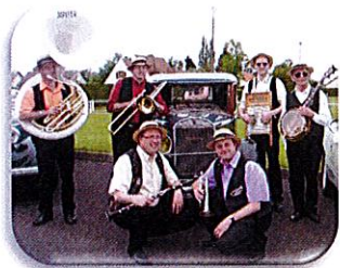
Orchestre de Jazz New Orléans